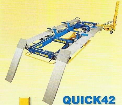
QUICK42 クイック 42