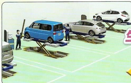
ウイングベイシステム