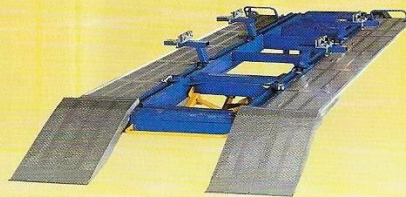
Bench Rack 5000 ベンチラック 5000