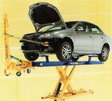
MARK 3~6 マーク 3~6