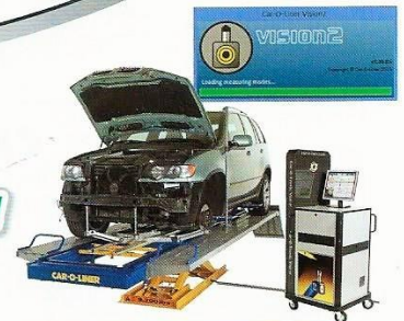
コンピューター計測システム